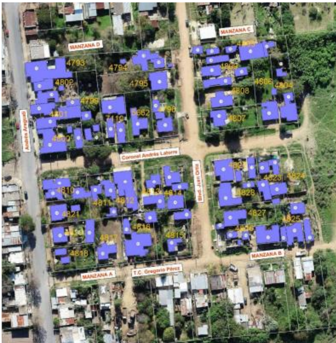
Lamina 2: Asentamiento “El Palomar” área de intervención. Viviendas relevadas.