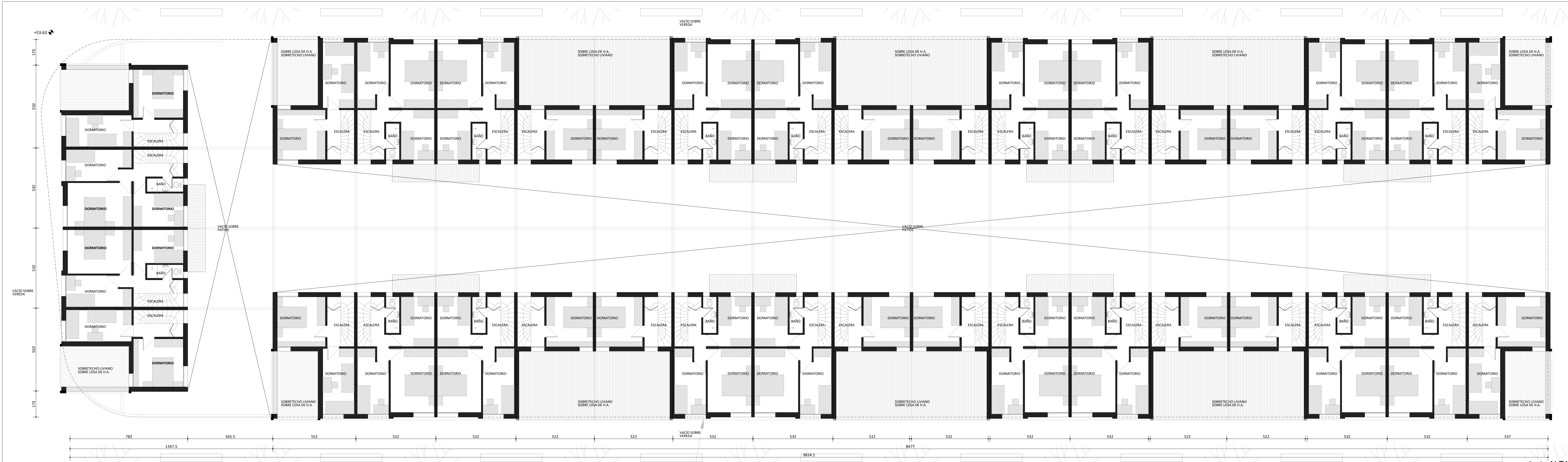
planta ALTA Escala: 1:100