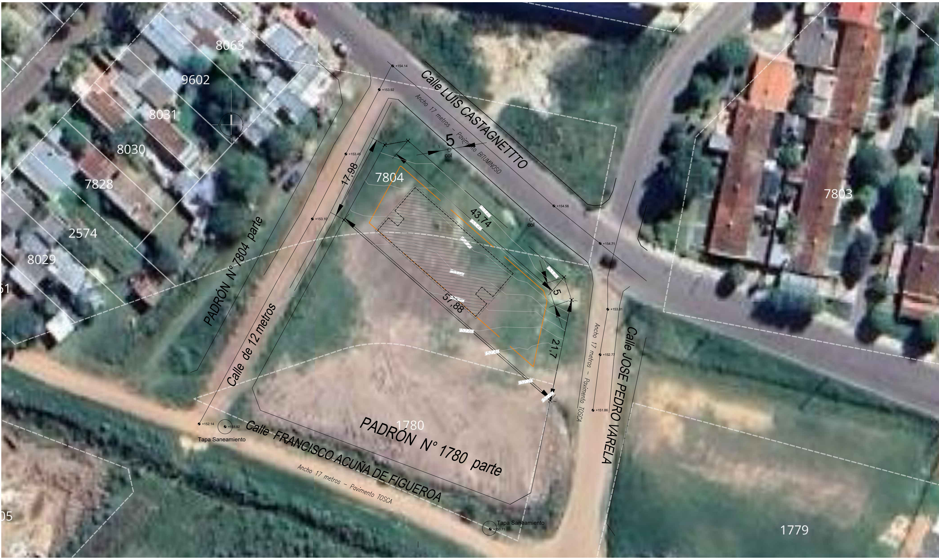
PLANTA UBICACION esc 1:500