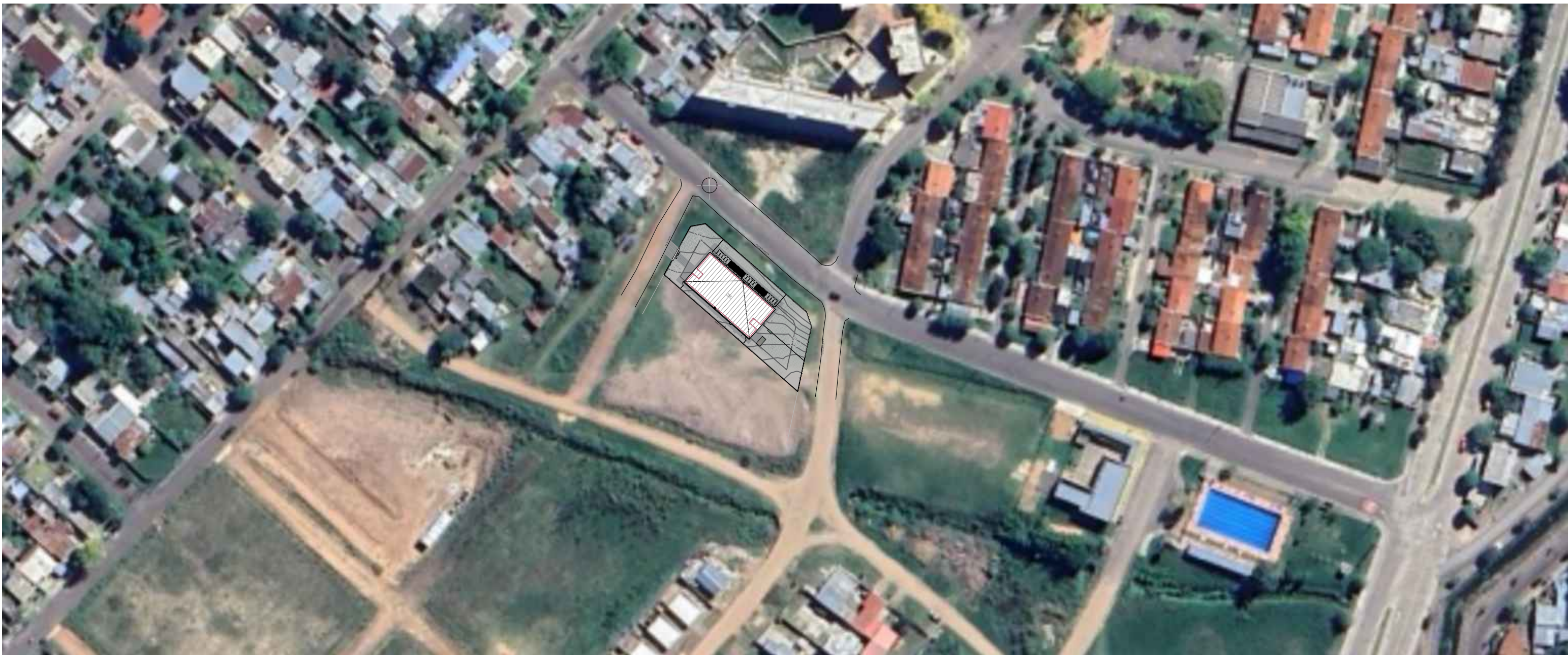
PLANTA UBICACION esc 1:1250