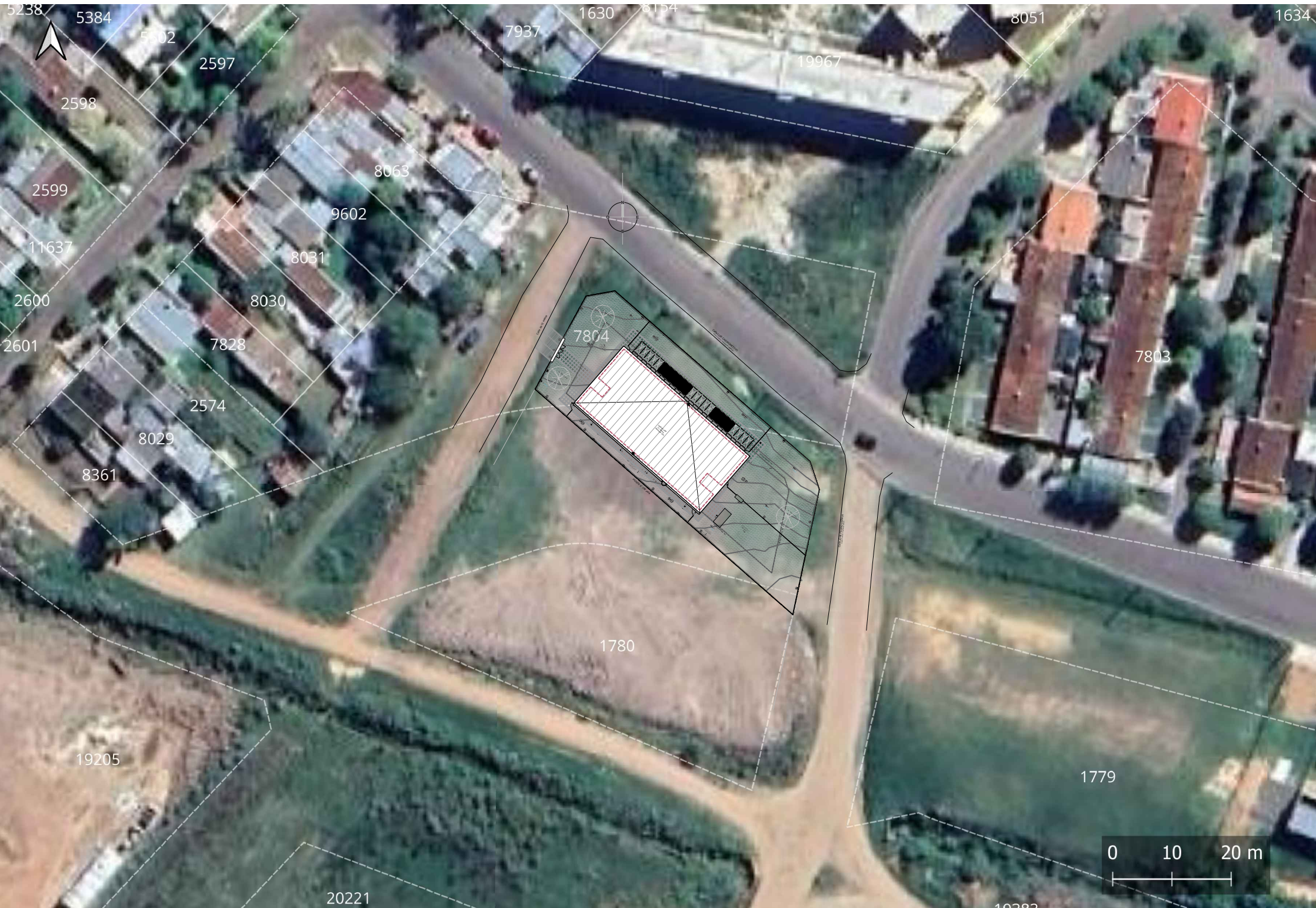
PLANTA UBICACION esc 1:750