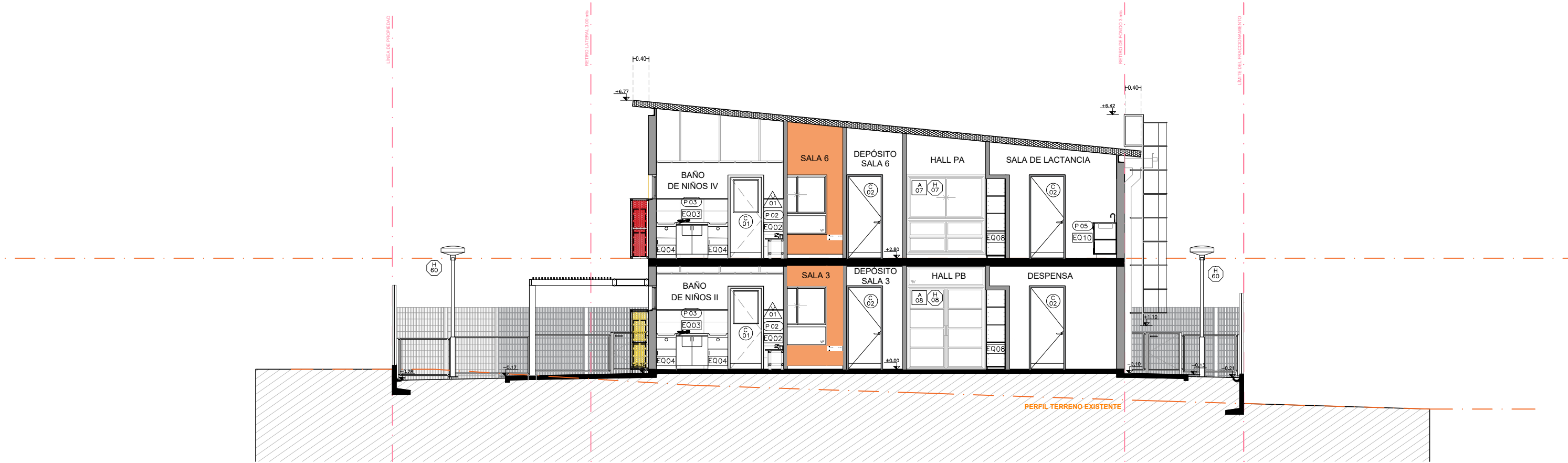
CORTE CC ESC: 1:100