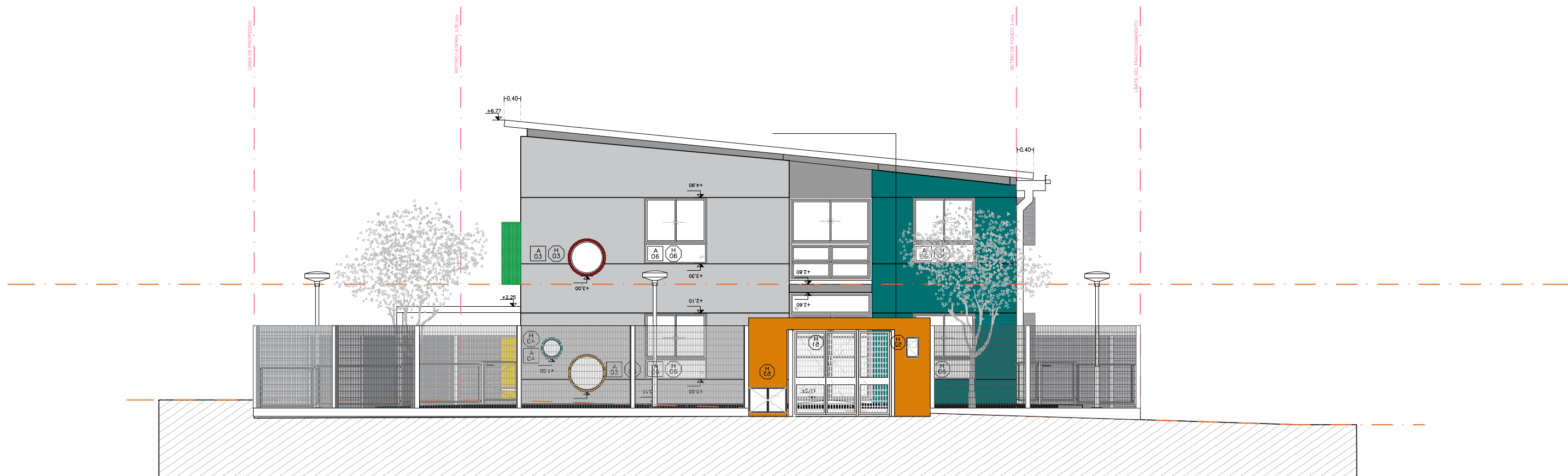
FACHADA NOROESTE ESC: 1:100