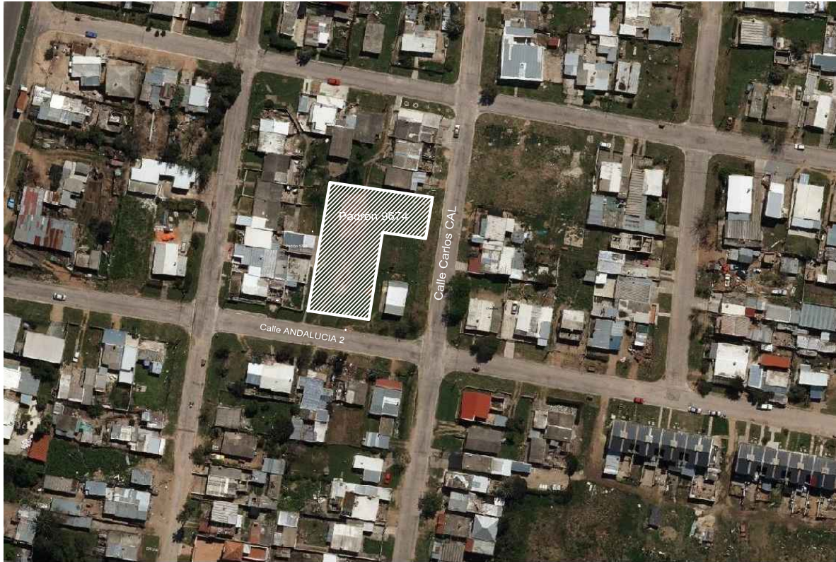
FOTO ÁEREA ESC 1_1500