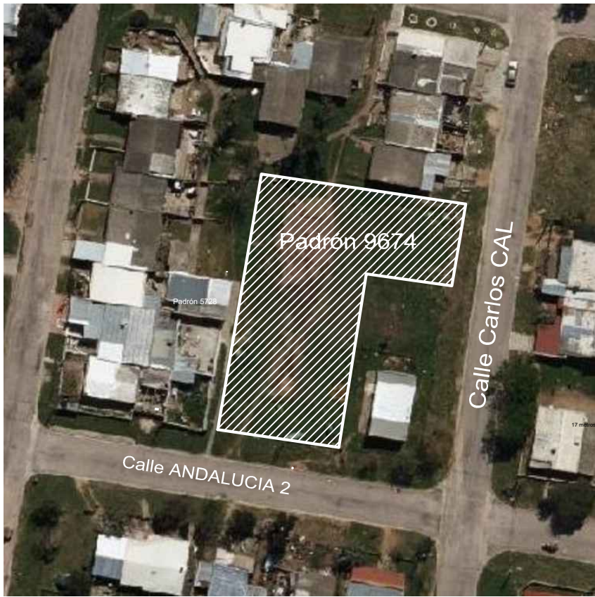
FOTO ÁEREA ESC 1_750