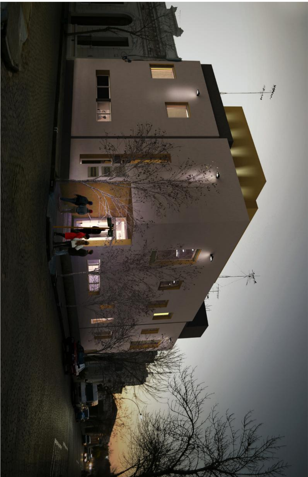
FACHADA CALLE LEANDRO GOMEZ Esc. 1:50