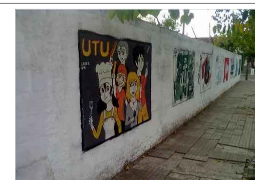
MURO CALLE NAVARRETE

FIDEICOMISO DE INFRAESTRUCTURA EDUCATIVA PÚBLICA ANEP - CND