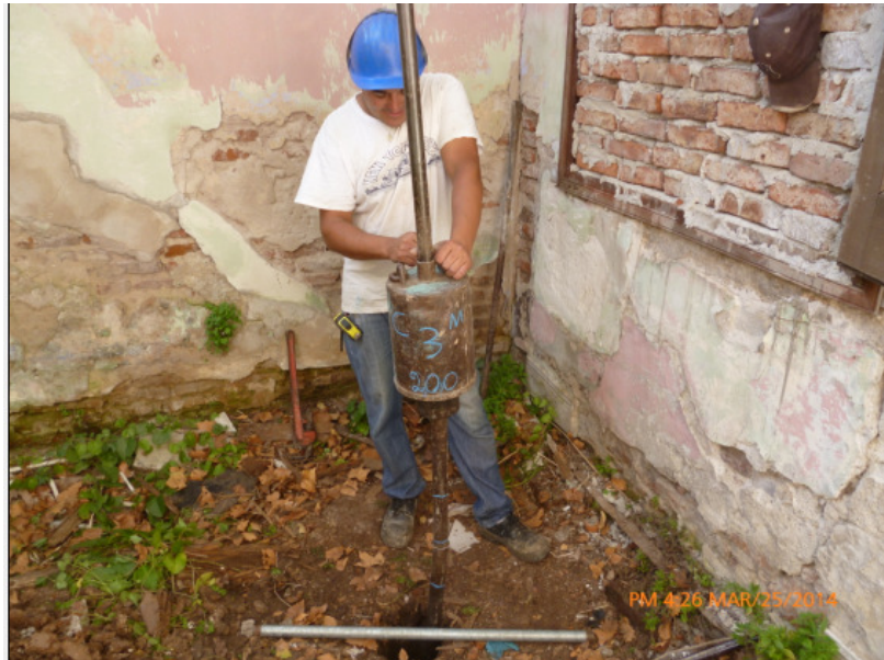
ARCILLA DE COLOR MARRON, PLASTICA, BLANDA